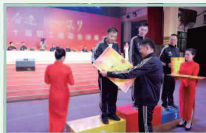
第十屆職工運動會閉幕式暨頒獎典禮