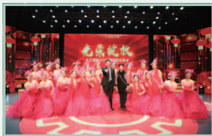
二零二一年度春節聯歡晚會表演節目

本集團於二零二一年二月舉辦了二零二零年度總結表彰大會，總結本集團二零二零年度的發展成果。我們亦頒發獎項及獎金表揚報告期內工作表現優秀的個別員工及團隊，肯定他們為本集團作出的貢獻。獎項包括天工勞模、最佳團隊、銷售之星、創新之星和最佳新人等。