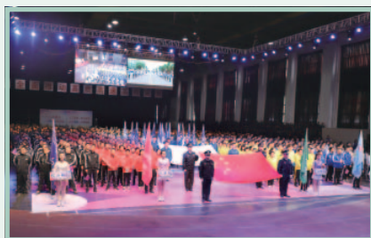
第十屆職工運動會開幕式

於報告期內，本集團舉辦了第十屆職工運動會。本屆運動會共設超過二十項個人及團體比賽項目。此項盛事充分展示了員工團隊合作及勇於拼搏的精神。本集團準備超過一百三十多項獎項，表揚比賽成績傑出的員工。