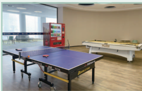
乒乓球及桌球設備