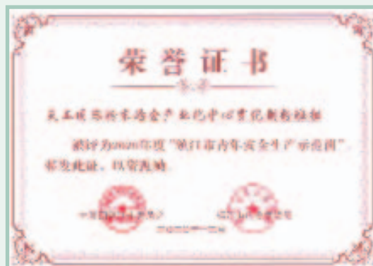
二零二零年度「鎮江市青年安全生產示範崗」榮譽證書

報告期內，本集團的粉末冶金產業化中心霧化制粉班組被評為二零二零年度「鎮江市青年安全生產示範崗」。