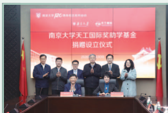
南京大學天工國際獎助基金捐贈設立儀式

於報告期內，本集團捐出一千萬元人民幣設立「南京大學天工國際助學基金」，支持南京大學的莘莘學子，為人才培養提供重要支持和動力。該基金下設有「天工國際海外交流獎學金」和「天工國際獎助學金」。「天工國際海外交流獎學金」主要用於資助學業成績突出且家庭經濟困難的研究生和本科生赴外國一流大學或一流研究機構交流訪學，助力中國的新材料行業發展；「天工國際獎助學金」則主要資助品學兼優的學生順利完成學業。