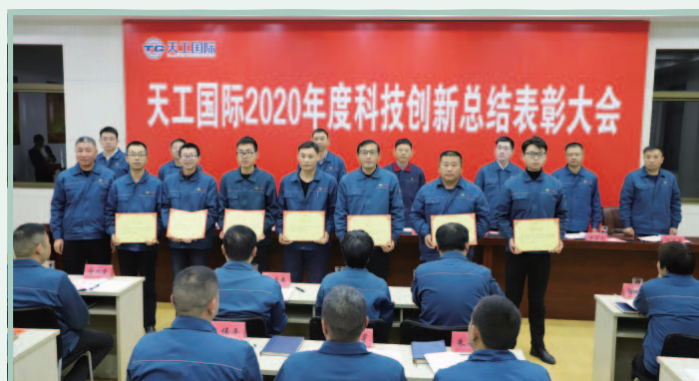
二零二零年度科技創新總結表彰大會

我們鼓勵員工勇於創新，加快新產品研發、工藝革新等工作。於報告期內，本集團召開了二零二零年度科技創新總結表彰大會，頒獎表揚在科技創新工作中表現優異的個別員工及團隊。本集團亦在大會中總結報告期內的科技創新工作所取得的成果及可改善之處，並且介紹二零二一年度的科技創新工作計劃。